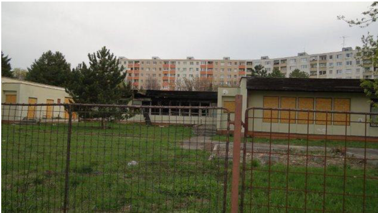
budova Znievska 2